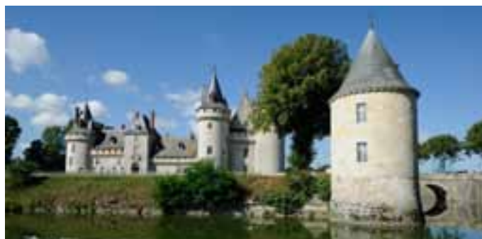
Château de Sully-sur-Loire

Ce château, lieu du mariage de Charles VIII avec Anne de Bretagne présente une architecture représentative de la deuxième moitié du XV ème siècle. Une série de tapisseries des "sept Preux" constitue une partie de sa décoration d'intérieur. Ces panneaux tissés en basse lisse ont été réalisés entre 1525 et 1540.