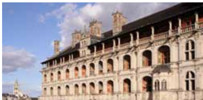
Château royal de Blois

Lieu privilégié de son enfance, François 1 er , reste attaché à cette résidence royale tout au long de son règne. Il y fait construire notamment l'étage du logis Louis XII. Par ailleurs, d'illustres personnages comme Léonard de Vinci ou Charles Quint sont reçus au château par le souverain.