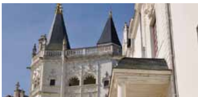
Château des Ducs de Bretagne

Lieu fort depuis le Xe siècle, il devient vers 1605 la résidence des ducs de Sully, la famille de Béthune. Au XVII e siècle Maximilien de Béthune, le grand Sully, ministre d'Henri IV, aménage le donjon et renforce les levées contre les crues. Le lieu fut marqué notamment par deux visites du roi François 1 er en 1517.