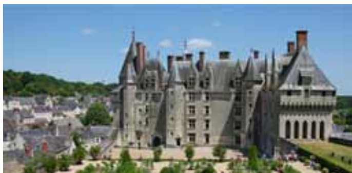
Château de Langeais