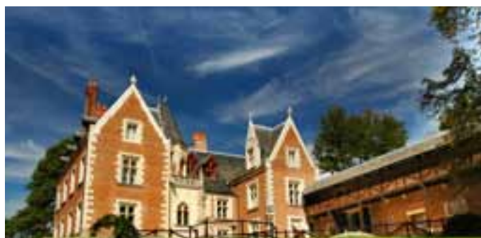
Clos Luc  - Parc Leonardo da Vinci

La Cit  Royale est le r sultat mill naire des multiples constructions  rig es sur l' peron rocheux dominant la vall e de l'Indre. Le logis fut une r sidence occasionnelle des rois de France. Les r gnes des rois Valois sont une p riode prosp re pour la ville qui s'installe   ses pieds. François 1 er y rencontre Charles Quint en 1539.