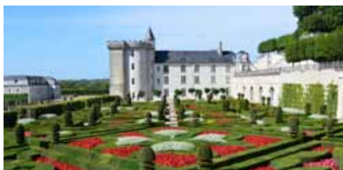
Château et jardins de Villandry

L'ouest du château est composé de deux corps de logis du XV ème siècle en équerre. Ils témoignent des travaux du duc et de la duchesse Anne, avec des fenêtres et lucarnes du gothique flamboyant et un double escalier en vis aux baies ouvertes ajourées. C'est là qu'en 1532 François 1 er signe l'édit prononçant l'union perpétuelle des pays et Duché de Bretagne avec le Royaume de France.