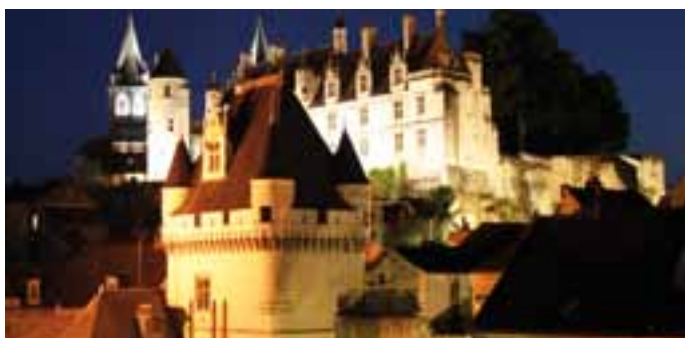
Cit  royale de Loches

Ce château féodal devient résidence royale sous Louis XII. Dès 1515, le nouveau roi lance la construction de l'aile dite François 1 er dont la tour d'escalier polygonale annonce l'avènement du style de la Renaissance française. C'est dans ces murs qu'est constituée la première bibliothèque royale de François 1 er .