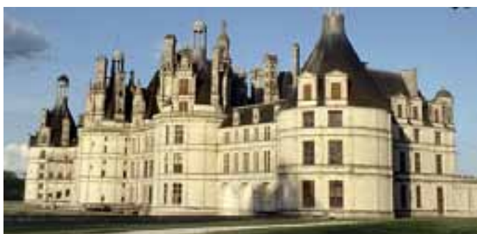
Domaine national de Chambord

A quelques pas du ch teau royal d'Amboise, le Clos Luc  est  galement un lieu affectionn  par François 1 er depuis son plus jeune  ge. Devenu roi, il offre le manoir en 1516   L onard de Vinci, qui y r s de pendant les trois derni res ann es de sa vie. Le ma tre italien y con oit et dessine de nombreux projets et y  labore des d cors de f te.