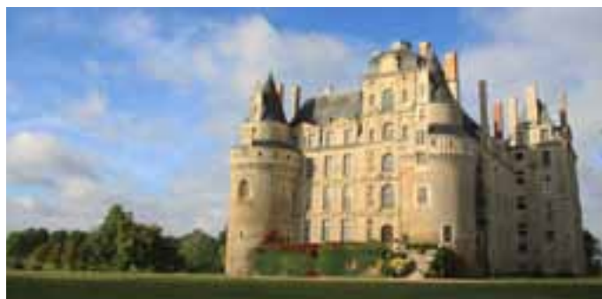
Château de Brissac

Ce joyau d'architecture est construit sur une île de l'Indre par l'un des plus importants financiers du roi, Gilles Berthelot, entre 1518 et 1527. Les riches éléments de décors sont l'illustration parfaite du style de la première Renaissance française.