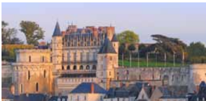
Château royal d'Amboise

Lieu privilégié de son enfance, François 1 er , reste attaché à cette résidence royale tout au long de son règne. Il y fait construire notamment l'étage du logis Louis XII. Par ailleurs, d'illustres personnages comme Léonard de Vinci ou Charles Quint sont reçus au château par le souverain.