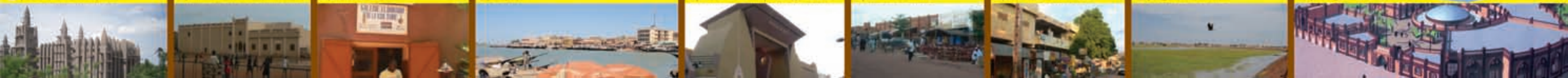
12 | Village artisanal